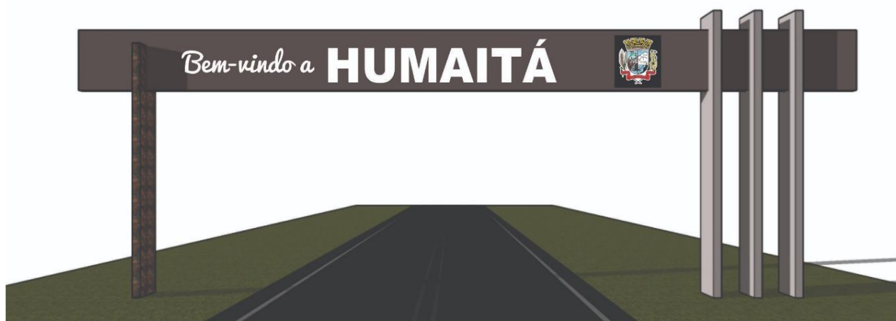
Imagem 01: Vista do Pórtico, sentido de chegada à cidade.