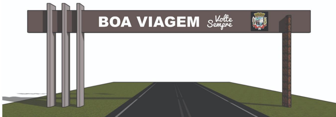
Imagem 02: Vista do Pórtico, sentido de saída da cidade.